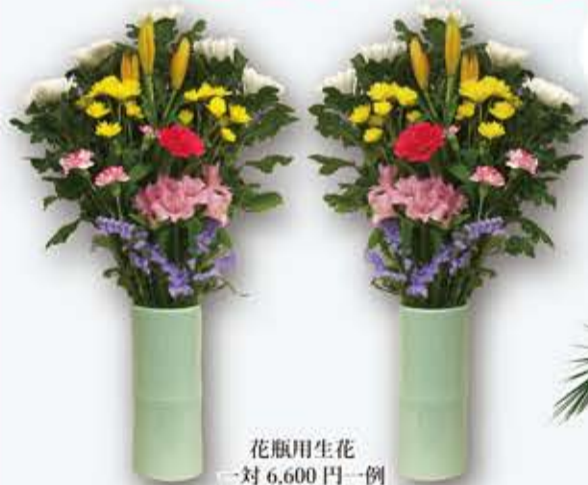
花瓶用生花 一对 6,600円一例

ありがたいの花をたむけて、故人・ご先祖様を偲ぶ… 皆さまのお盆供養を心を込めてお手伝いします