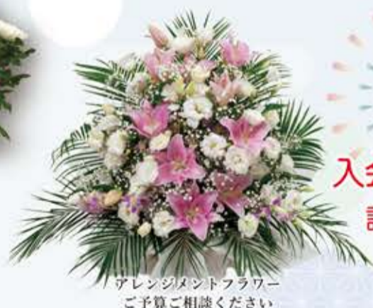
アレンジメントフラワー ご予算ご相談ください

らく楽 お花の定期便 入会キャンペーン実施中 詳しくは店頭スタッフへ お声掛けください。